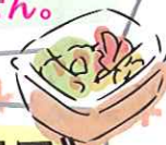
ピンチョスのメニュー例

当日2月22日(木)・23日(金・祝) 四ヶ町アーケード内マクドナルド前 FM させぼ 1階に チャージ機を特設